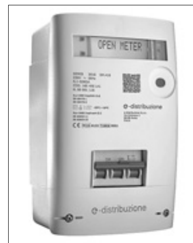
Elektronski števec open meter