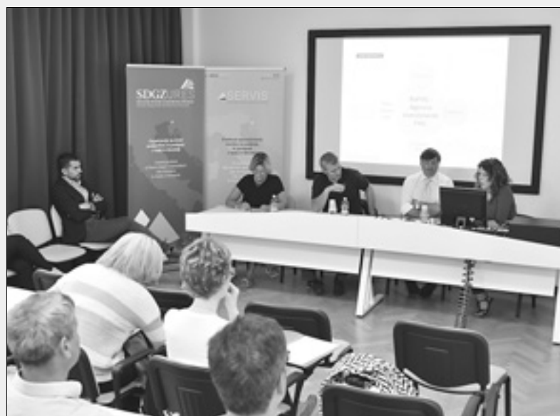
Strokovno srečanje na sedežu SDGZ

Deželna agencija za naložbe (www.investinvg.it) si prizadeva, da bi podjetniki iz FJK izvajali naložbe in da bi sem tudi prihajala podjetja iz drugih okolij. Do 6. julija, denimo, je v okviru programa Rilancimpresa za spodbujanje klasičnih in bolj inovativnih naložb gospodarstvenikom na razpolago 2,6 milijona evrov. Do konca septembra lahko obrtniki vložijo prošnje na center CATA za preureditev in izredno vzdrževanje delovnih prostorov, tehnološke inovacije, itd. Podjetja, ki s težavo najdejo na trgu delovno silo, ki jo potrebujejo, se lahko obrnejo na deželno agencijo za delo. Ta bo v roku enega tedna izvedla selekcijo in ponudila podjetjem ožji krog kandidatov. Agencija omogoča, da se zaposleni stalno izobražujejo (tudi »po meri« podjetij) in brezposelni poklicno